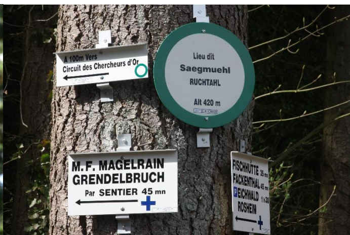
Compositions avec des lettrages prédécoupés