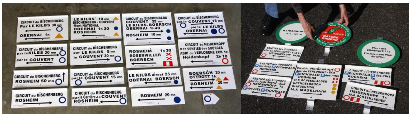
A partir des années 2000, pose de nouveaux panneaux sur le circuit du Bischenberg et sur celui du Heidenkopf