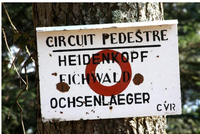
Panneau directionnel peint à la main par Fernand

Tous ces marquages, il les peignit au pinceau et sur des plaques en tôle pendant une trentaine d'années. A partir des années 2000, progressivement, il les remplaça par des compositions en lettrages plastiques noirs prédécoupés par ordinateur, autocollants et à fixer sur des plaques en aluminium. Le nouveau système s'avéra certes être plus cher mais plus rapide à mettre en œuvre et surtout plus durable dans le temps.